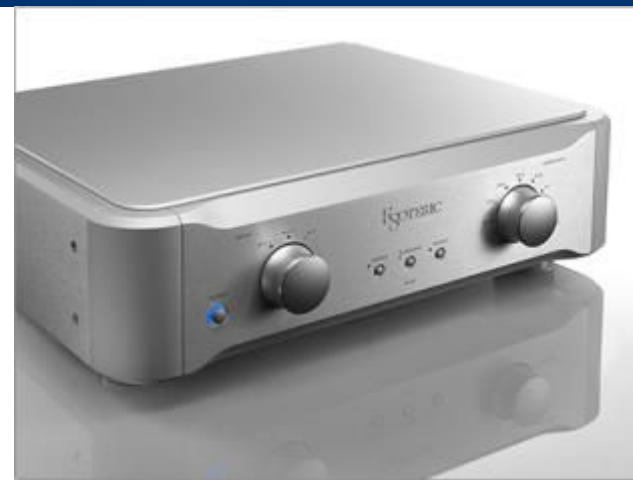
フルバランス・フォノアンプ『E-02』

アナログ再生の頂点をめざし、2017年7月にフルバランス・フォノアンプEsoteric『E-02』を販売開始しました。レコード愛好家の想いに応え、永年にわたり積み重ねたアナログ再生技術の精髓を昇華させました。海外でも高い評価を獲得し、8年のロングヒットとなったフォノアンプE-03のフィロソフィを継承しつつ、理想的なMCカートリッジの全段バランス伝送・増幅を実現。愛蔵するレコードに、いま新たな生命が注がれます。