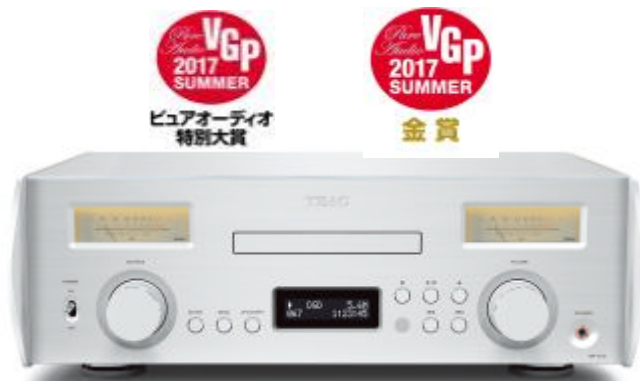
ピュアオーディオ特別大賞 アンプ一体型プレーヤー(25万円以上50万円以下) ネットワークCDプリメインアンプ『NR-7CD』

日本で権威のあるオーディオビジュアルアワード「VGP 2017 SUMMER」において、以下のTEAC製品が各賞を受賞いたしました。