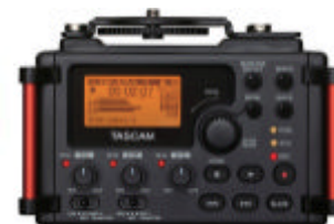
カメラ用リニアPCMレコーダー /ミキサー『DR-60DMKII』