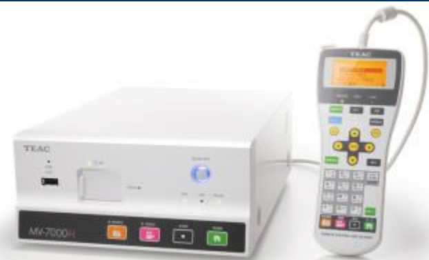
内視鏡イメージレコーダー『MV-7000シリーズ』

以前より定評のあるTEACの消化器内視鏡向け医用画像レコーダーの新製品『MV-7000シリーズ』を、2017年5月より販売開始しました。内視鏡検査中でも過去の検査画像を呼び出して表示できる機能を新たに装備。過去の画像と現在の画像をモニターに表示し、現場で経過を確認しながら検査を進めることができます。対応記録メディアも増やし、フロントパネルでの操作性も格段にアップさせました。国内の消化器内視鏡市場向けに、年間1,000台の販売を予定しています。