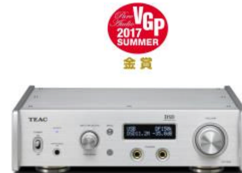
DAC/DDC デュアルモノラル USB DAC/ヘッドホンアンプ『UD-503』