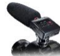
ショットガンマイク搭載 カメラ用リニアPCM レコーダー『DR-10SG』