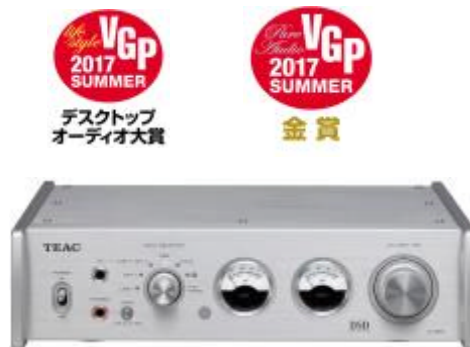
デスクトップオーディオ大賞 プリメインアンプ(10万円以上20万円未満) USB DAC/プリメインアンプ『AI-503』