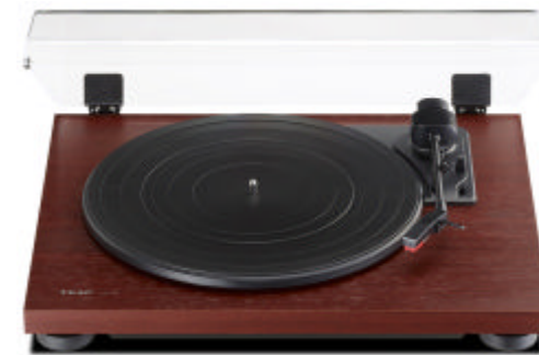
アナログターンテーブル『TN-100』

2017年7月に、エントリーユーザー向けのターンテーブル『TN-100』を販売開始いたしました。近年、国内外におけるアナログ盤の出荷台数の増加に伴い、レコードに親しんできたオーディオファンのみならず、トレンドに敏感な10代をはじめとする若年層に至るまで、アナログレコードへの関心が広がりつつあります。当社もこの市場に新機種を投入することで新規ユーザー層のさらなる獲得を目指していきます。