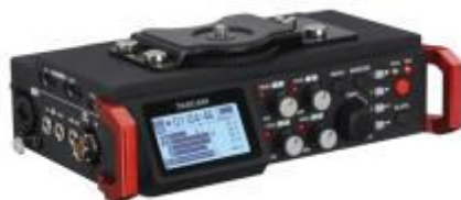
カメラ用リニアPCM レコーダー『DR-701D』