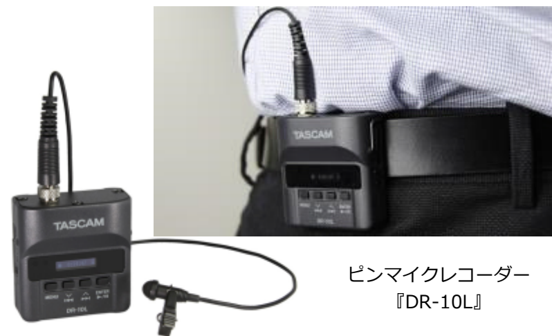
ピンマイクレコーダー 『DR-10L』

『DR-10L』は、ピンマイクから直接録音することが可能なレコーダーです。軽量、コンパクトなウェアラブル設計で、手軽に高音質な音声収録ができます。シンプルな操作と多彩な機能で、ブライダル、イベントや番組、舞台での音声収録から講義やセミナーの録音など、幅広い用途において、確実な録音をサポートします。