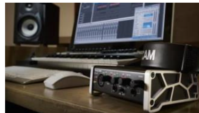
オーディオインターフェース『US-1x2』

定評のあるTASCAMブランドのUSBオーディオインターフェースラインナップの中でも、音楽制作に特化した最もシンプルかつコンパクトなモデル、TASCAM『US-1x2』を2017年6月に販売開始しました。少ない機材知識でも簡単にプロフェッショナルクオリティの高音質レコーディングを楽しんで頂けます。特に、これからパソコンを使ったレコーディングを始めたいミュージシャンに最適なモデルです。