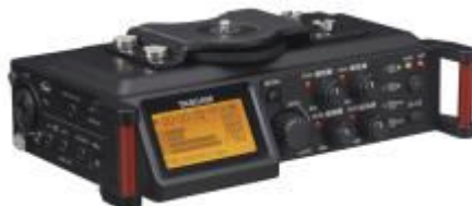
カメラ用リニアPCMレコーダー /ミキサー『DR-70D』